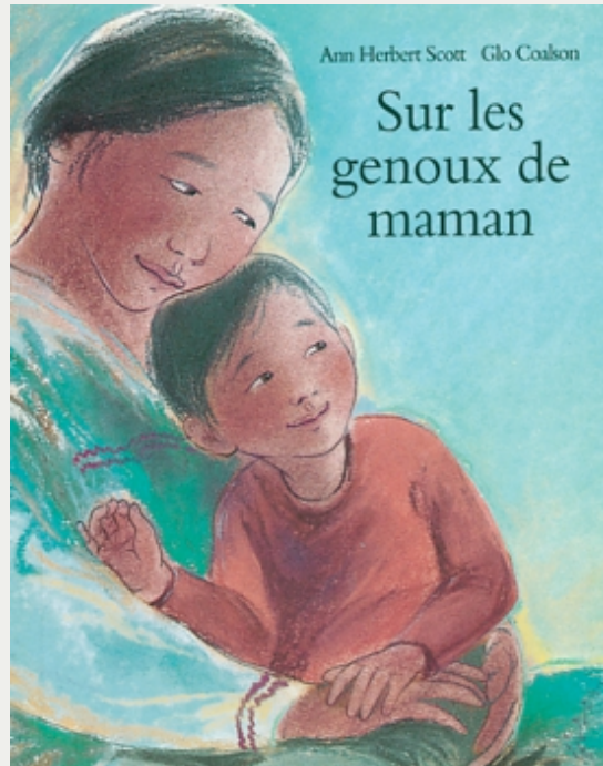
«Sur les genoux de maman» d'Anne Herbert Scott et Glo Coalson (© L'École des loisirs)

ont totalement décroché et être tentés de mettre fin à la lecture. Et soudain un indice nous prouve le contraire: l'enfant va chercher un objet en lien avec l'histoire, en répéter un mot tout en jouant, ou se tourner ostensiblement vers nous, attendant la suite de l'histoire.