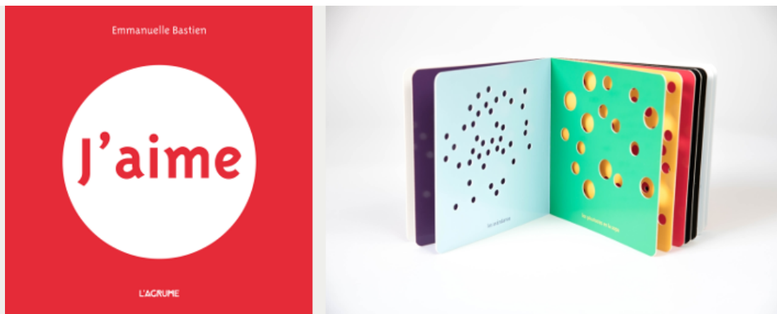
Couverture et image intérieure de «J'aime» d'Emmanuelle Bastien

Les images ont également leur importance. Si la vision des bébés nous incite à choisir de préférence des images contrastées et aux couleurs vives, l'expérience montre qu'ils peuvent être captivés également par des tons pastel, des pages fourmillantes de détails. Ils ne sont pas en mesure d'identifier tout ce qui est représenté (de la même façon qu'ils ne comprennent pas toujours le texte lu) mais ils en retirent du plaisir et c'est cela que l'on recherche.