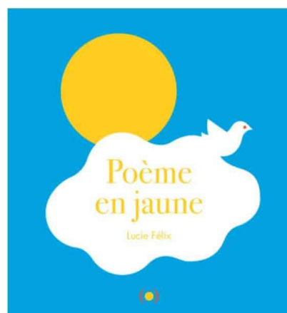
Poème en jaune , Lucie Félix Ed. Les Grandes Personnes, 2022