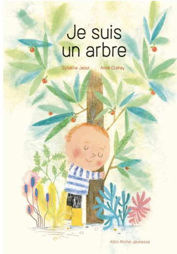
Je suis un arbre Sylvaine Jaoui, Anne Crahay, 2021, Albin Michel Jeunesse

Cet album grand format sur l'universalité des besoins est construit comme un dialogue entre un enfant et un arbre, tous deux en devenir :