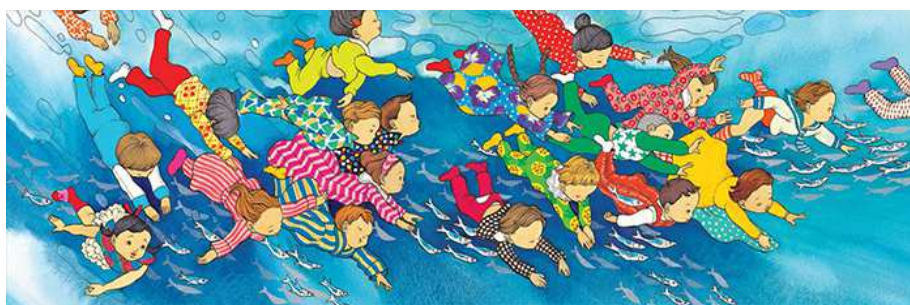
Bonne nuit, la mer et tous les poissons.